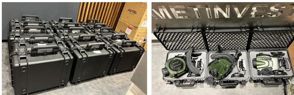
Недавно военные получили новое дефицитное оборудование от Метинвеста – 15 спутниковых артиллерийских комплексов по наведению огня

Спасать жизнь защитников на фронте помогают более 31 тысячи аптечек и кровоостанавливающих турникетов.