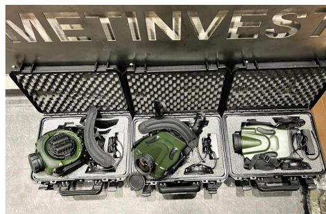
Недавно военные получили новое дефицитное оборудование от Метинвеста – 15 спутниковых артиллерийских комплексов по наведению огня

Спасать жизнь защитников на фронте помогают более 31 тысячи аптечек и кровоостанавливающих турникетов.