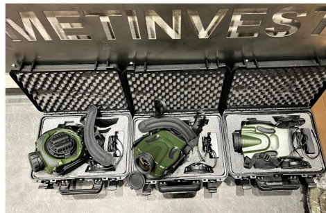
Недавно военные получили новое дефицитное оборудование от Метинвеста – 15 спутниковых артиллерийских комплексов по наведению огня

Спасать жизнь защитников на фронте помогают более 31 тысячи аптечек и кровоостанавливающих турникетов.